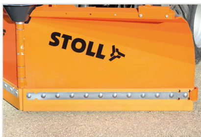
Räumleisten nach Wahl

Anbau 3 Pkt, Kat.0/I oder Kat.II, Anbau Kuppeldreieck Kat.0 Kat.I oder Kommunalausführung, Anbauplatte an div. Fahrzeuge mit Aushubvorrichtung Fahrzeugseitig (Fabrikate anfragen), Schnellwechselrahmen mit Parallelausgleich für Radlader (Komatsu, Kramer, Terex, Yanmar, Liebherr etc.), Gabelzinkenaufnahme, Schnellwechselrahmen mit Geräteaufn. für 3 Pkt. Kat.I/Kat.II (auch für andere Anbaug.), Aufnahmesystem wird zusätzlich benötigt - ein doppelt wirkender Steuerkreis ist erforderlich